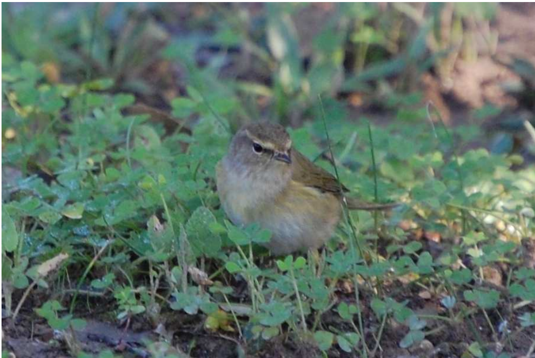
Luì grosso (R.N.O. Sughereta di Niscemi, 21-XII-08)