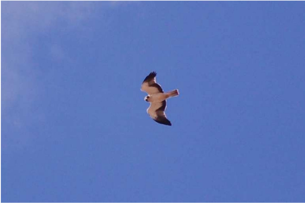
Aquila minore (Foto M.Zafarana, C.da Canaicchio, Niscemi, 25-XI-08)